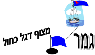
מצוף דגל כחול

יציאה לים מותרת רק לאחר הנפת דגל "D" בחוף